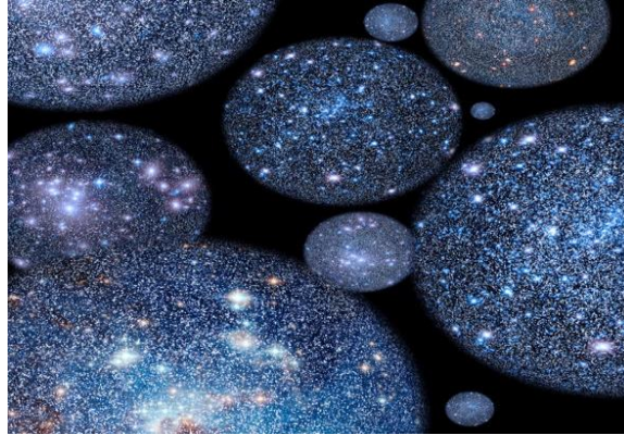
H4_Vũ trụ song song trong biển đại giác (hình minh họa)

thường, còn vô số các sao ở xa (cũng thuộc dải Ngân Hà) ta không phân biệt được mà nhìn thấy chúng chi chít hợp thành một vệt sáng vắt ngang bầu trời, giống như một con sông bạc (ngân hà). Ở thành thị khó thấy được dải Ngân Hà vì bị ánh sáng đô thị che lấp (Nguồn: Mihail Minkov)