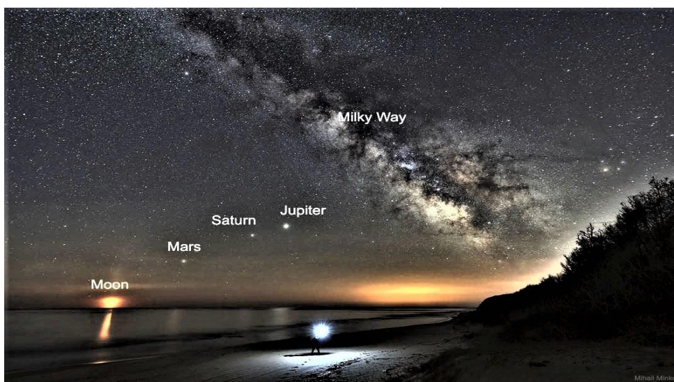
H3_Thiên hà chứa hệ mặt trời ta đang sống có tên là dải Ngân Hà (Milky Way)_Tất cả các sao ta thấy trên bầu trời (các chấm sáng trên hình) đều là các sao thuộc dải Ngân Hà, chúng ở gần nên ta mới phân biệt được bằng mắt