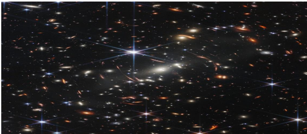
H1_Một vùng vũ trụ cực xa do kính thiên văn không gian Webb chụp năm 2022, góc nhìn vùng không gian này xấp xỉ bằng góc nhìn một hạt cát đặt cách mắt chúng ta một khoảng vài tay. Các đốm sáng có hình dạng khác nhau là các thiên hà. (Các đốm sáng có 6 tia gai nhiễu xạ là các sao tiền cảnh ở gần ta, không phải các thiên hà)